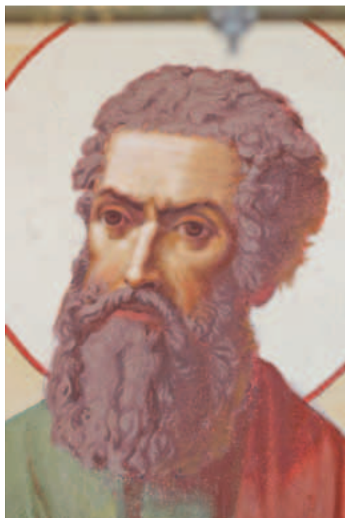
6. Апостол Павел. Фрагмент воссозданной композиции «Предстояние святых апостолов Петра и Павла Спасителю»