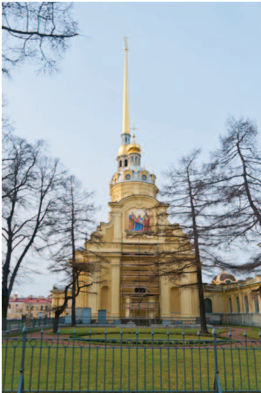
2. Восточный фасад Петропавловского собора с воссозданной композицией «Предстояние святых апостолов Петра и Павла Спасителю»