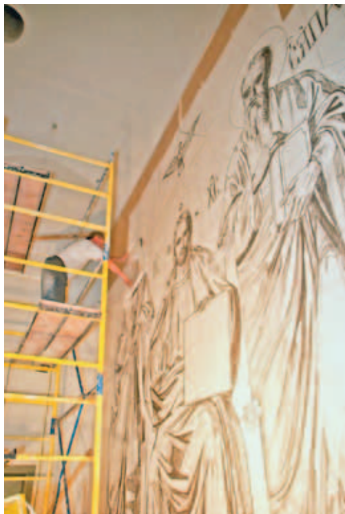
7. Работа над картоном композиции «Предстояние святых апостолов Петра и Павла Спасителю»

задача решения цветового строя композиции. Не было ни одной цветной фотографии росписи. Эскизы выполнены акварелью, они давали представление приблизительное. Роспись, исполненная маслом, не может быть точно воспроизведена силикатными красками, совершенно иными по своему звучанию. Следовательно, необходимо было найти убедительную аналогию, выражающую идею новыми средствами. Задача усложнялась еще и тем, что из существующих силикатных красок (а их насчитывается 270 цветов) я имел не полную палитру. Это были 10 цветов, используемых при