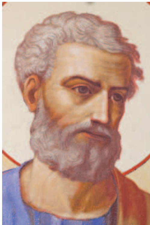
5. Апостол Петр. Фрагмент воссозданной композиции «Предстояние святых апостолов Петра и Павла Спасителю»