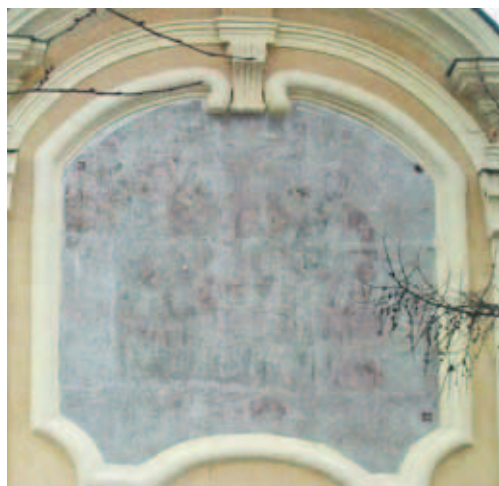
1. Композиция «Предстояние святых апостолов Петра и Павла перед Спасителем». Фото 2006 г.

Согласно акту обследования объекта «Собор Петра и Павла» по адресу Петропавловская крепость д. 3, составленному КГИОП СПб 24 февраля 2004 г., отмечена сохранность красочного слоя не более чем в одной десятой части всей площади композиции. По результатам осмотра предлагается, учитывая утраты значительной части практически всей живописи, воссоздать ее заново. Предварительные работы включали подробное изучение сохранившихся фрагментов красочного слоя (для определения цветовой гаммы воссоздаваемой композиции); снятие калек с сохранившихся фрагментов; определение состояния штукатурной основы; разработку мето-