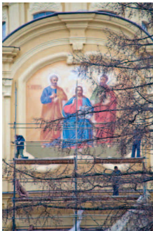
8. Демонтаж лесов после завершения воссоздания композиции «Предстояние святых апостолов Петра Павла Спасителю» Декабрь 2013 г.