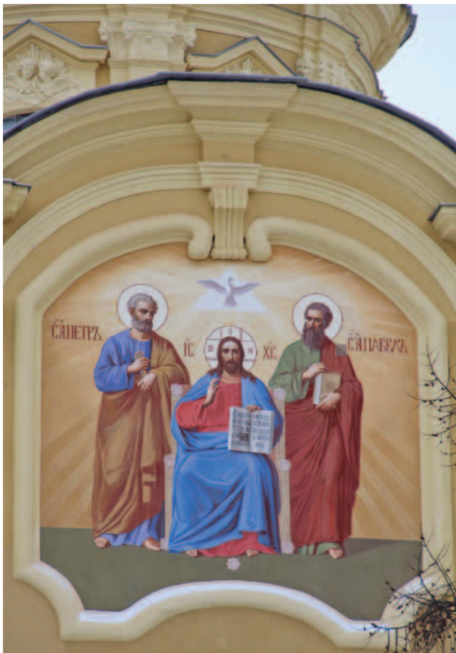
3. Композиция «Предстояние святых апостолов Петра и Павла Спасителю» После воссоздания