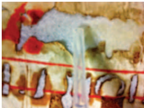
2. Лист рукописи на пергаменте В процессе реставрации

проведенными на пергаментном листе, хранившемся в архиве № 98 Научно-исследовательского института реставрации и консервации города Кёльна.