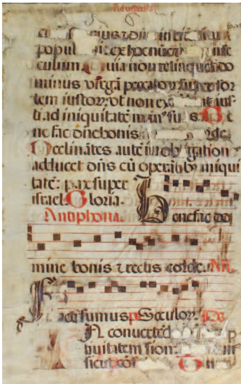
4. Лист рукописи на пергаменте. После реставрации