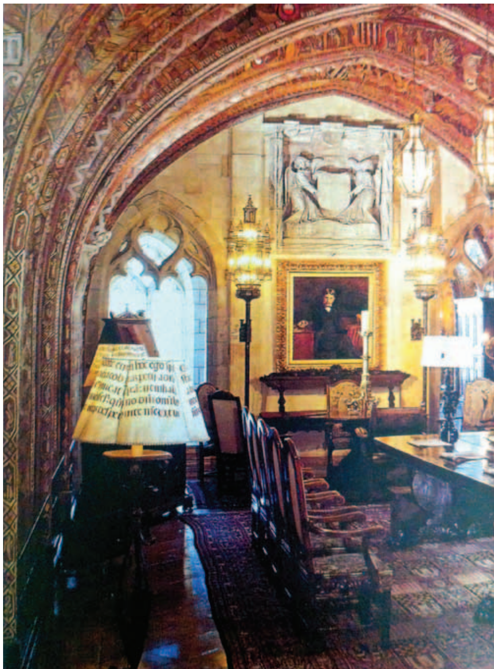
1. Абажуры для ламп, выполненные из пергаментных листов